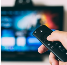
Edupool in Schulen