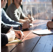
Netzwerktreffen für die EDV-Betreuung