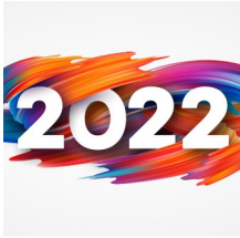
Rückblick auf 2022