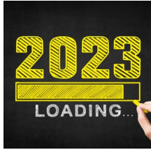
Ausblick auf 2023 im KreisMedienZentrum