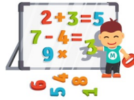
Ausblick 2023 vor allem für GRUNDSCHULEN