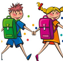
Das Jahr der Grund- schule 2023