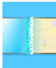
Inhalte Medienentwick- lungsplan (MEP)