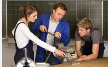
BBS'n / RdL