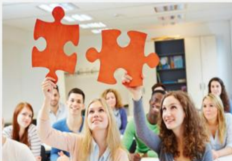
Anmeldeverfahren & Hilfestellungen